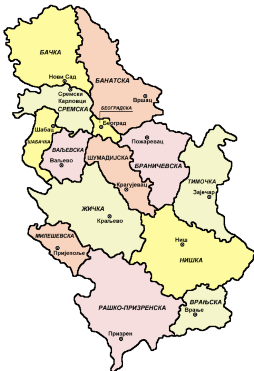
Епархије Српске православне цркве у Србији (2006. године)