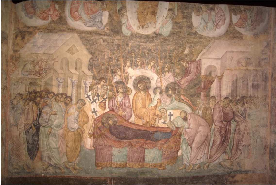
Kraljeva crkva, Studenica, USPENJE, detalj: